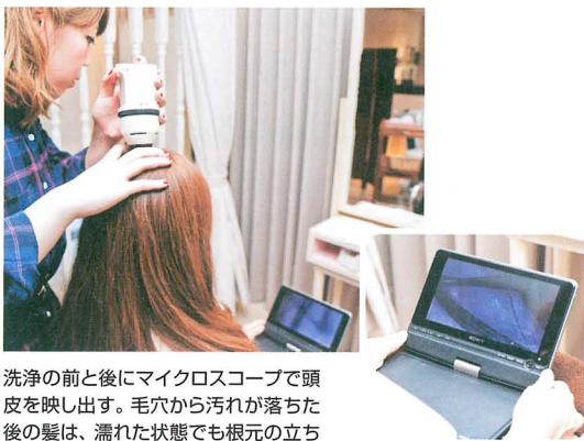
洗淨の前と後に顕微鏡で頭皮を映し出す。毛穴から汚れが落ちた後の髪は、濡れた状態でも根元の立ち上がりが出ているのがわかる。

一般的になじみのある「ヘッドスパ」より、デトックス効果とアンチエイジング効果が高いメニューとして、頭皮洗淨をアピールしている。日頃からお客様とは美と健康に関する話題が多い。このメニューも「いつまでもヘアスタイルを楽しむための頭皮ケア」ということを理解してもらっている。